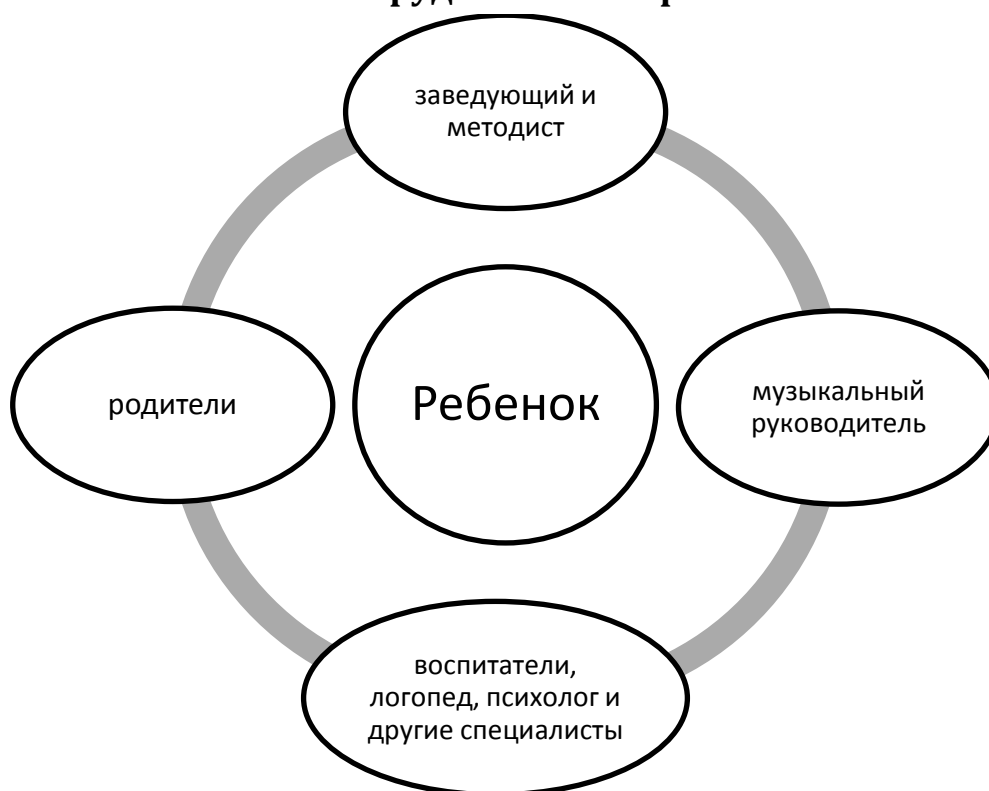
Схема сотрудничества взрослых

Целевые ориентиры – результаты освоения программы «Музыкальная палитра»